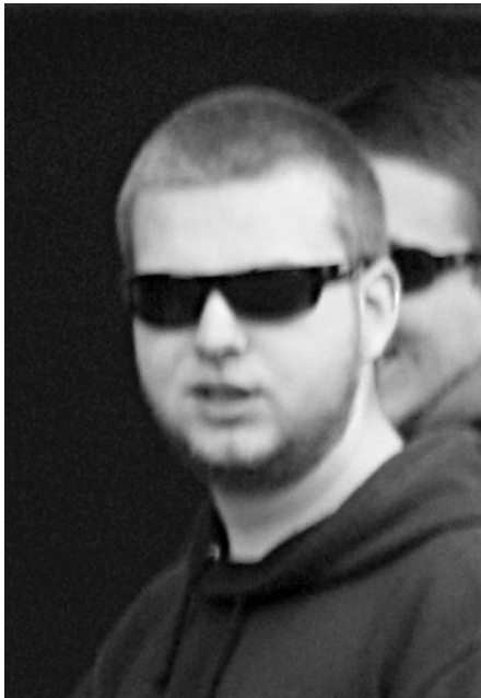
auf dem Weg zu einem Naziaufmarsch in Heilbronn am 1. Mai 2011