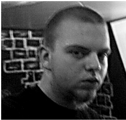
auf einem Privatfoto